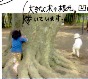
(大きな木の根元。凹凸しいおみよがな 歩いてます。)