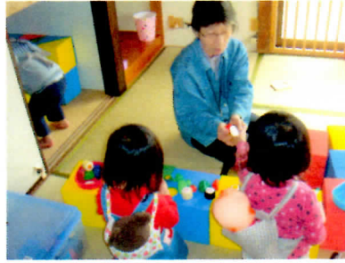
お母さん、2人でお買物。 何を買うのびょうが...?