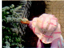
ユキヤナギの花。「まわ」といい気持ち。