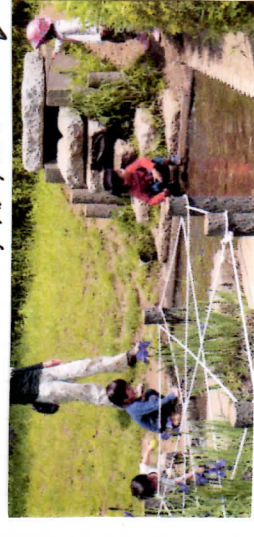
どんへ行つてしまったの? 文理台公園の池には、木アシヤクもカエルもいないから

5月は、いろいろな公園へ遊びに行きました (場所が変われば、遊びも変わります。ほんの一部をご紹介します)