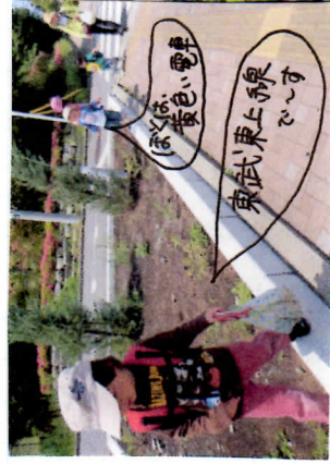
黄色い電車 東武東上線 電車

赤木のステージで大合唱♪ 自分でマイクも作りました。 それぞれに別の歌を歌っているの呀