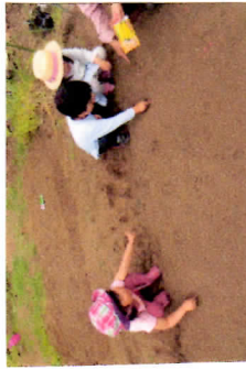
トウモロコシ、エンドウ、セマシの苗を植えます。沖崎も順調呀。

5月は、電車を前に陸橋へ寄り道、公園からの帰り道、いつもと違う道を通る探検、人数の少ない日の遠出と歩く楽しさが増えました。「あ、ちへ行こう」「00へ行きた」と子どもが思いつくようにしたためです。少人数からこそ、保育者も子どもも互いに、一人一人の思いがよく見えて理解できます。思いが大事にされますし、おもしろいことだつてあります。そうしながら、川へ入らず、子ども同士が親しくなつてきていっているのがわかります。