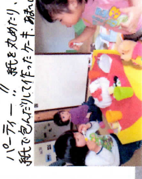
ハートー!! 紙を文めたり、紙で包んだりに作ったケーキ、紙をい