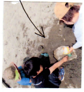
カップに水をくみ、何往復もして、水をためました