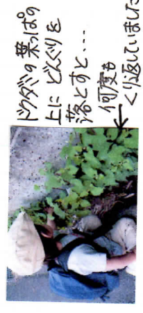
ドクダミの葉っぱの上にビシビシと落とすと... 何度かくり返して