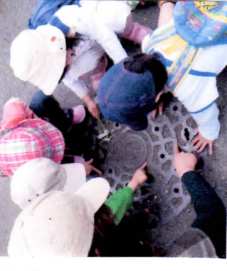
迷路スタート! ある日突然、マッホーレの足が、迷路に見えちゃったの呀